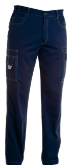
BLU NAVY/BLU ROYAL