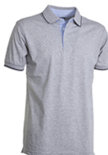
GRIGIO MELANGE/BLU NAVY