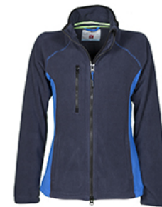
BLU NAVY/BLU ROYAL