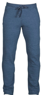
BLU DENIM MELANGE