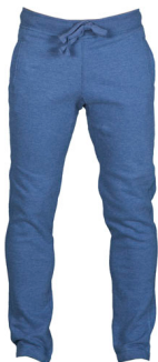
LIGHT DENIM MELANGE