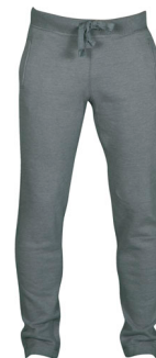
STEEL GREY MELANGE