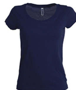
BLU NAVY SEAPORT