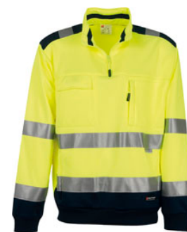
GIALLO FLUO/BLU NAVY