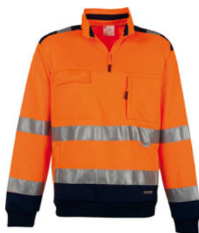
ARANCIONE FLUO/BLU NAVY