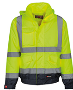
GIALLO FLUO/BLU NAVY