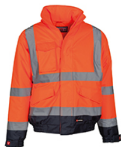
ARANCIONE FLUO/BLU NAVY