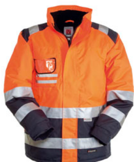
ARANCIONE FLUO/BLU NAVY