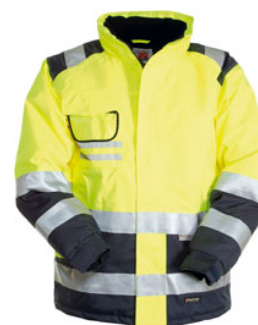
GIALLO FLUO/BLU NAVY