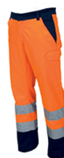
ARANCIONE FLUO/BLU NAVY