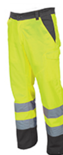
GIALLO FLUO/STEEL GREY