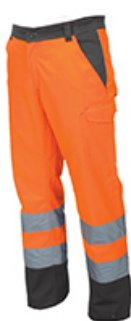
ARANCIONE FLUO/STEEL GREY