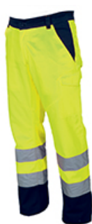
GIALLO FLUO/BLU NAVY