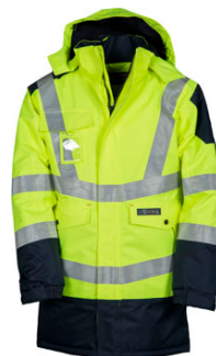
GIALLO FLUO/BLU NAVY